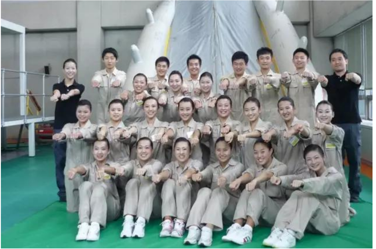
在韩国韩亚航空训练紧急逃生