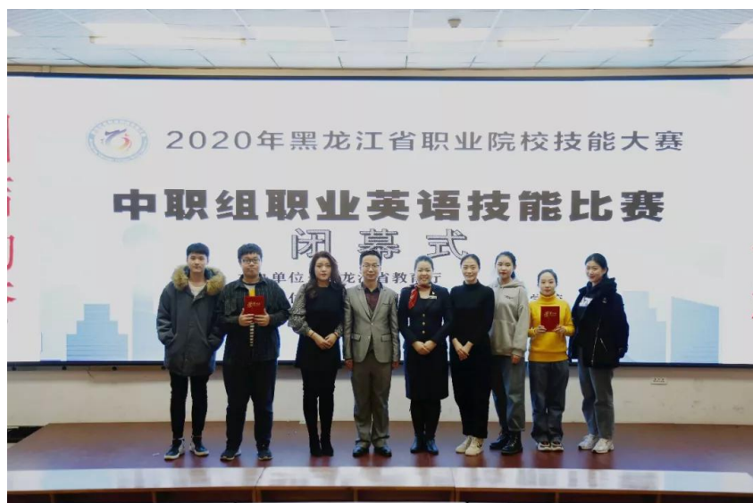
我校获奖学生合影

作为本次大赛的承办单位，学校严谨有序的赛事安排、温馨细致的赛事服务赢得了裁判和各参赛队的交口称赞。