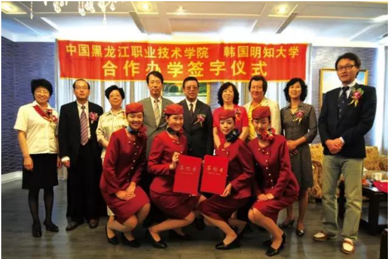
与韩国明知大学合作办学