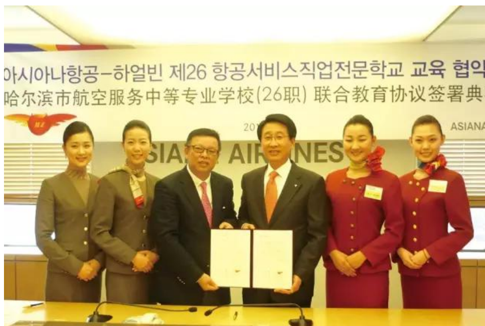
与韩亚航空签订联合教育协议

在国际化办学战略指导下，除培养和派送大批教师参加国际化培训外，先后与韩国韩亚航空，明知专门大学，荷兰国际管家学院，德国马格德堡 wmv 集团，西班牙美塔基航空学院建立合作关系！